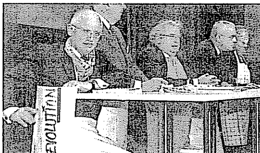
Günter Verheugen, vicepresidente europeo, sostiene en el Market Place de Bruselas la propuesta de Caja Navarra sobre su Cuenta Cívica.

des compañías exponen sus compromisos con políticas de conciliación familiar, con valores sociales y con proyectos educativos y de desarrollo en el Tercer Mundo. La única empresa navarra participante fue Caja Navarra con su Cuenta Cívica. »8